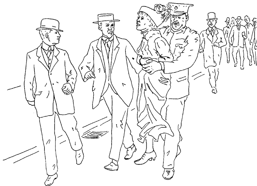
Vesna Bukovec, Emmeline Pankhurst, aretacija pred Buckinghamsko palačo, London, 1914, iz serije In vendar me briga/And yet I do bother , 2019